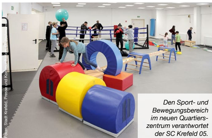
Den Sport- und Bewegungsbereich im neuen Quartierszentrum verantwortet der SC Krefeld 05.

Kreuz. Kooperationspartner für den Sport- und Bewegungsbereich im Ladenlokal ist der SC Krefeld 05.