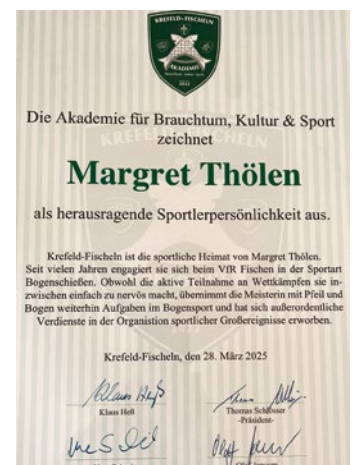
Der Originaltext der Auszeichnung für Margret Thölen.