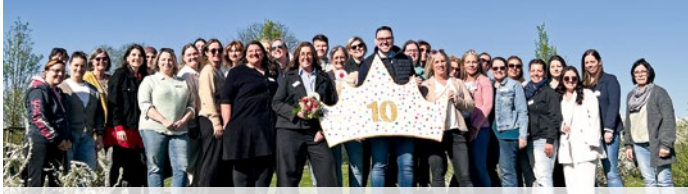
Das Team der Kita Krützboomweg feierte das 10-jährige Jubiläum mit einem stimmungsvollen Fest.

Familienzentrum mit einem Schwerpunkt auf Naturwissenschaften