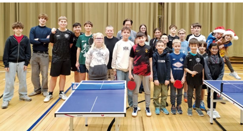
Gute Stimmung auf der Weihnachtsfeier.