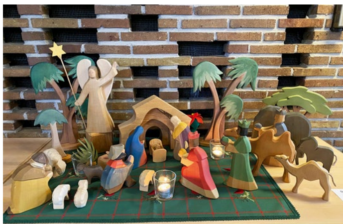
Holzkippe mit Figuren der Heiligen Familie, den Drei Königen und Tieren, umgeben von grünen Bäumen. Weihnachtliche Atmosphäre.

Krippen ausstellen möchten, statt sie auf den Dachboden zu bringen. Der Aufbau findet Samstag, 10.01.2026 von 16 bis 19 Uhr statt. Für die Sicherheit ist gesorgt: Die Krippen werden über Nacht bewacht. Der Abbau erfolgt am Sonntag, 11.01.2026, im Anschluss an die Ausstellung zwischen 15 und 16.30 Uhr.