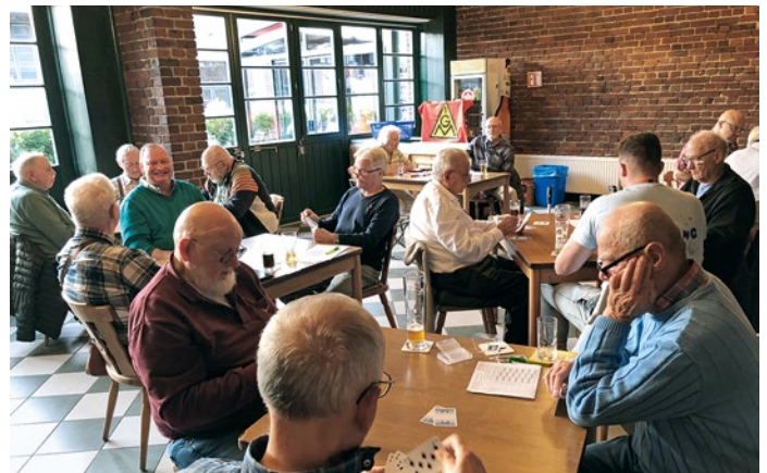
24 Spieler hatten sich zum Skatturnier der IG Metallsenioren in der Oppumer Großmarktkantine angemeldet.