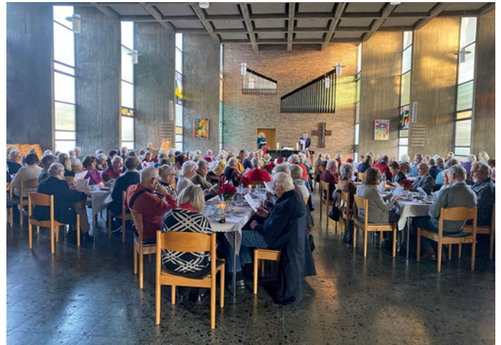
Gemeinschaft in festlichem Ambiente – ein herzlicher Moment bei Kaffee und Kuchen inmitten der beeindruckenden Architektur der Markuskirche.

Unter dem Motto „Mit den Hirten auf den Weg“ hat die Markuskirche ältere Menschen aus der Gemeinde mit Begleitperson zu einer stimmungsvollen Adventsfeier eingeladen.