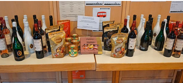
Für jeden Teilnehmer des ‚Strümpfer Männerfrühstücks‘ gab es ein Weihnachtsgeschenk zum Aussuchen.

Prof. Dr. Okko Herlyn beim Männerfrühstück in Strümp