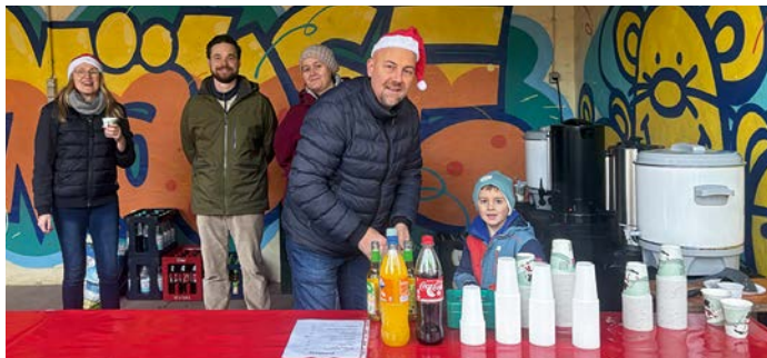
Gut gelaunt präsentierten sich Eltern, Erzieherinnen und Aussteller beim 1. Weihnachtsmarkt der 'Wühlmäuse'.