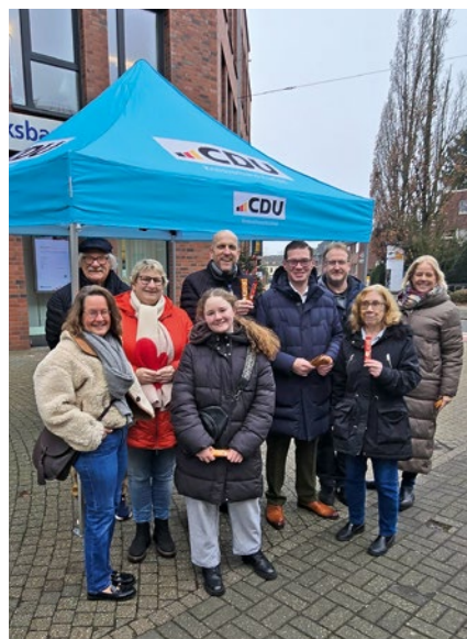
Mitglieder der CDU Fischeln luden an ihrem Stand zu Gesprächen ein und wünschten allen Bürgerinnen und Bürgern eine schöne Vorweihnachtszeit. Fotos: privat

Im Anschluss fand das traditionelle Weckmannessen der CDU Mitglieder im Fischelner Burghof statt. In ruhiger und geselliger Atmosphäre kamen Mitglieder und Unterstützer zusammen und nahmen sich Zeit für einen regen Austausch und nettem Beisammensein.