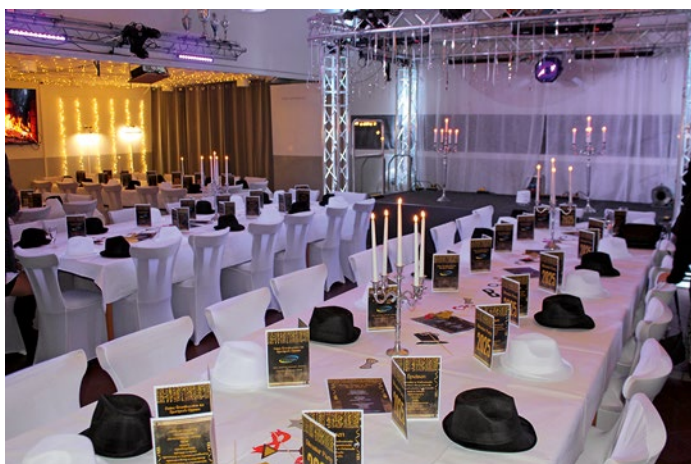
Der Saal im Sportpark Oppum taucht zur großen Silvesterparty ganz in schwarz/weiß – gern gesehen wird auch, wenn sich die Gäste in diesen Farben kleiden.

in diesem Jahr laden die Gastgeber zum Jahresabschluss in den großen Saal, der wieder komplett in schwarz/weiß dekoriert wird. „Wenn passend dazu auch die Gäs-