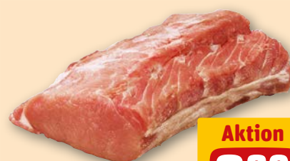
Schweine- Rückenbraten je 1 kg