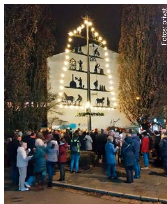
Unterm Zunftbaum: Stimmungsvoller Auftakt mit dem Fischelner Bürgerverein in den Advent.