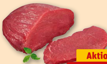
Rinder- Steakhüfte je 1 kg