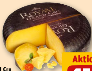
Beemster Royal Grand Cru holl. Hartkäse, mind. 48% Fett i.Tr., je 100 g