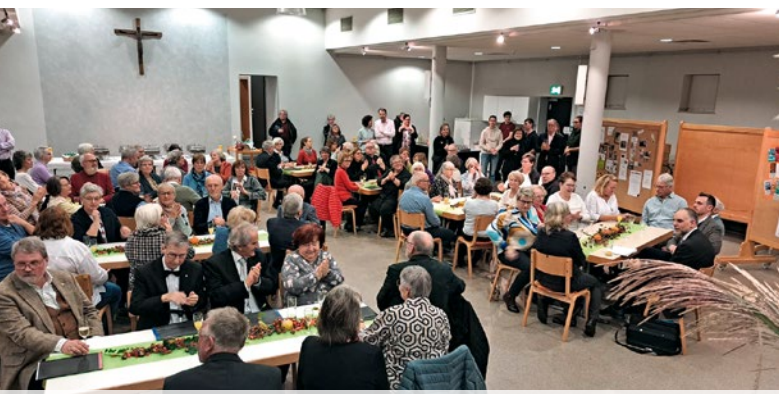
Ein volles Haus verzeichnete die KÖB St. Clemens bei ihrem 175. Jubiläum im Pfarrsaal.

„Bücher bringen Bildung“ – ein offenes Geheimnis, spätestens seit Antiquar Georg Wilsberg mit seiner Pfliffigkeit als Privatdetektiv die Münsteraner Kripo zur Verzweiflung treibt. Ungeachtet aller elektronischen Medien und der unzähligen optischen und akustischen Reize, die unsere Wahrnehmung überfluten, hat ein Buch mit seinem Duft nach angegilbtem Papier und verblässerender Druckerschwärze nichts von seiner Faszination verloren.