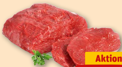
Rinder- Steakhüfte je 1 kg