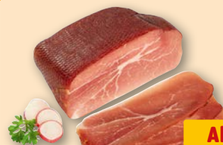
Kernschinken geräuchert, je 100 g