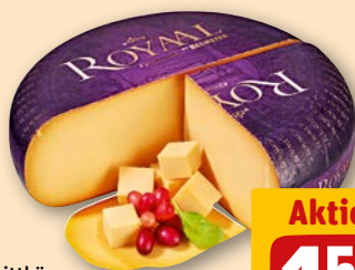
Beemster Royal holl. Schnittkäse, 48% Fett i.Tr., je 100 g