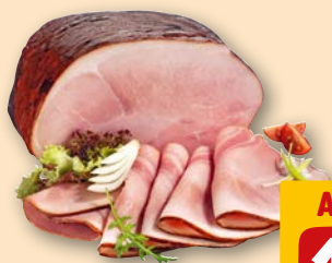
Klosterschinken je 100 g