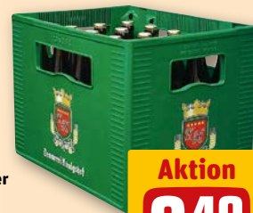
Brauerei Königshof Pils, Alt, Export oder Radler je 20 x 0,5-l-Fl.-Kasten (1 l = 0.85) zzgl. 3.10 Pfand