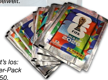
So geht's los: 7 Sticker-Pack für € 1,50.

Info: Foto Fuchs, Kölner Straße 550, Öffnungszeiten: Mo bis Fr 7.30 – 13.00 + 14.30 – 18.30 Uhr, Sa 8.00 – 13.00 Uhr