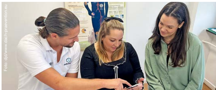
Nicht allein mit der Krankheit: Für Menschen mit familiärer Hypercholesterinämie stehen verschiedene Aufklärungsangebote bereit.

und den Blutgefäßen ablagert. Doch mit der richtigen Behandlung lassen sich die Cholesterinwerte wirksam senken. Damit reduziert sich auch das Risiko für Herz-Kreislauf-Erkrankungen wieder auf das durchschnittliche Niveau der Allgemeinbevölkerung. Voraussetzung ist, dass die Betroffenen von ihrer Krankheit wissen, die notwendigen Therapien bekommen und durchhalten.