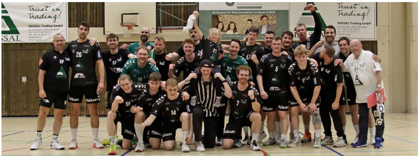
Die 1. Herrenmannschaft bejubelt ihren 34:33 – Sieg über die Turnerschaft St. Tönis