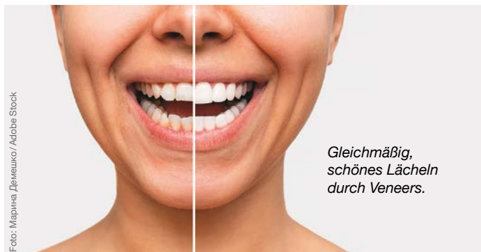
Gleichmäßig, schönes Lächeln durch Veneers.