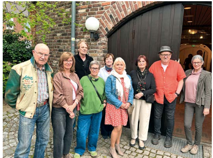
Die Mitglieder des Kunstkreises Meerbusch stellten ihre aktuellen Arbeiten aus.

zung von persönlichen Eindrücken wider. Gleichzeitig inspiriere eine Gemeinschaft von Künstlern gegenseitig. Und er riet den Gästen: „Sprechen Sie mit den Künstlern, finden Sie selber neue Perspektiven.“