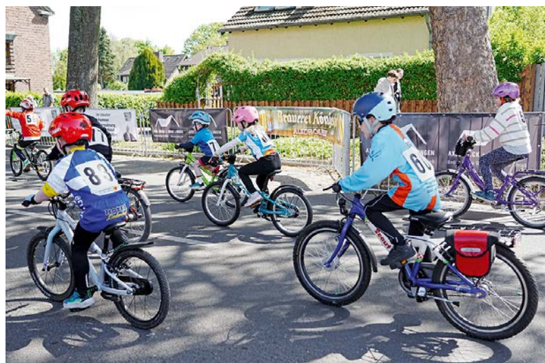
Auch die Jüngsten hatten ihren Spaß und nahmen zahlreich beim „Fette-Reifen-Rennen“ teil.