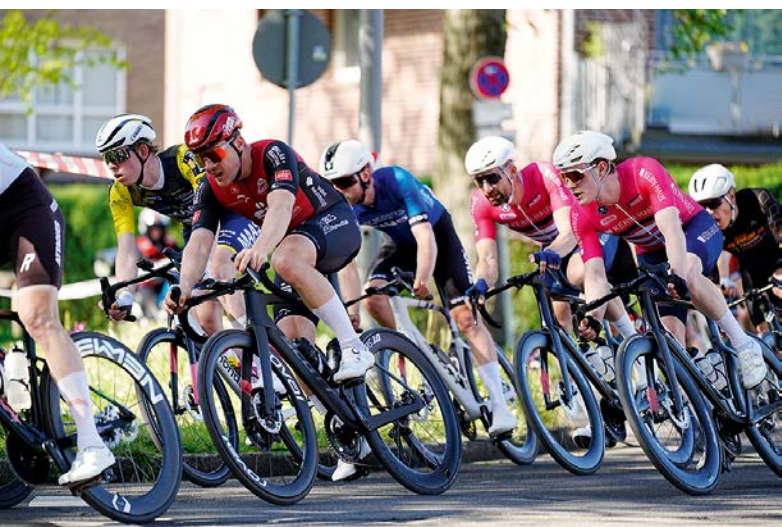
350 Radsportler sorgten bei ‚Rund in Fischeln‘ für spannende Rennen.

Mit Blick in die Zukunft zeigt sich das Organisationsteam optimistisch: „Wir freuen uns schon jetzt auf den Renntag im nächsten Jahr“, so Linders abschließend. Red.