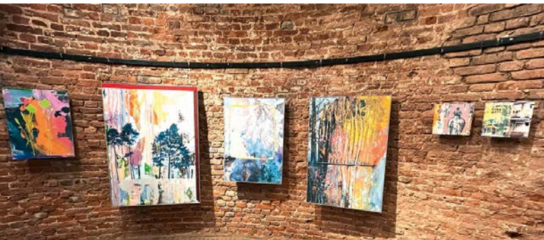
In der natürlichen Rundung der Teloy-Mühle verstärkt die Hängung der Bilder die optische Wirkung zusätzlich.

Teloy-Mühle: Kunstkreis Meerbusch präsentiert sich