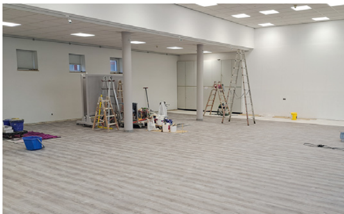
Hell, freundlich und einladend: der Pfarrsaal in neuem Ambiente.