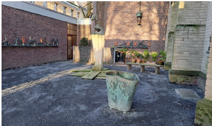
Das Pflaster im Kreuzgang ist entfernt, Granitsplit ist aufgetragen, der Endzustand aber noch nicht erreicht.