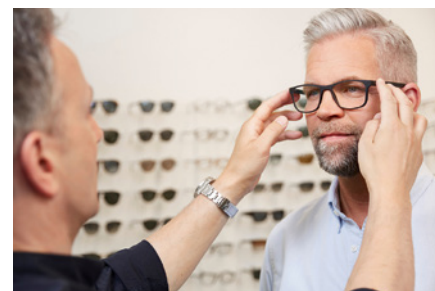
Passt die Brille auch richtig? Der Augenoptiker sorgt neben einer scharfen Sicht auch für den optimalen Sitz.

Augen-Screenings, die ebenfalls zum Leistungsspektrum der Gesundheitshandwerker gehören, erfordern Profession und Expertise. Augenoptiker und Optometristen können verschiedene Sehfunktionen testen, wie zum Beispiel das Dämmerungssehen, die Lesefähigkeit oder die Augenbeweglichkeit (Motilität). Mit speziellen Geräten kann unter anderem der Augeninnendruck gemessen oder die Netz-