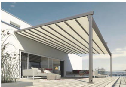
weinor PergoTex II – die Pergola-Markise für jedes Wetter