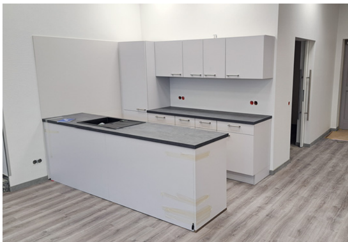
Die neue Küchenzeile fügt sich harmonisch ein und erhöht die Funktionalität.