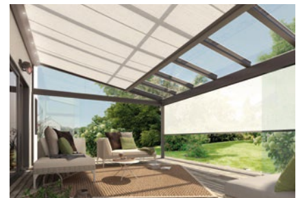
weinor Wintergartenmarkisen – Alleskönner im Ganzjahreseinsatz

Technische Änderungen sowie Sortiments-/Programmänderungen vorbehalten. Die Abbildungen können Sonderausstattungen zeigen, die nicht zum Standard-Lieferumfang gehören. Alle Texte und Abbildungen sind urheberrechtlich geschützt und Eigentum der jeweiligen Hersteller. Drucktechnisch bedingt sind Farbabweichungen möglich. Keine Haftung für Druckfehler.