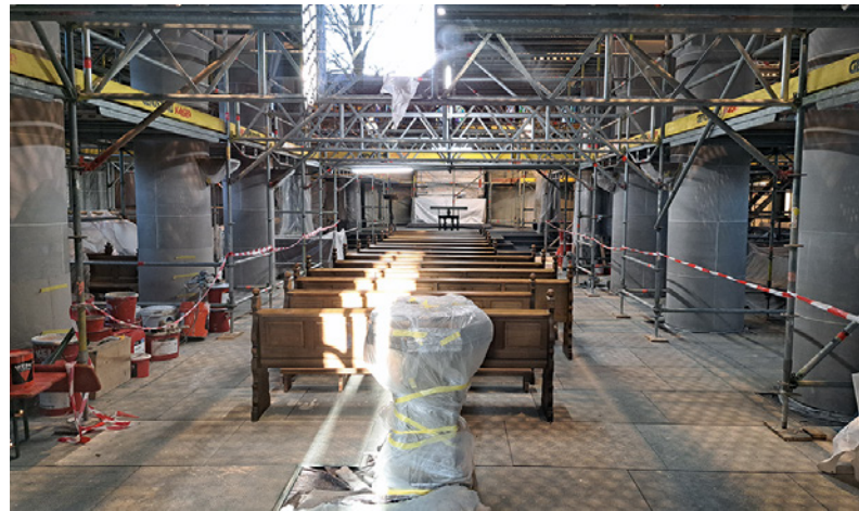
Altar und Taufbecken gut verpackt, drumherum noch viel Baustelle. Aber die Arbeiten gehen gut voran.

Vielversprechend präsentiert sich der Blick in den Pfarrsaal: eine neue Beleuchtung, ein heller Laminatboden und eine neue Küchenzeile lassen den lange bestehenden und steril anmutenden Retro-Eindruck des Saales schnell vergessen. Auch hier kann sich die Gemeinde auf ein Ambiente freuen, in dem das Feiern gleich doppelt soviel Spaß machen wird.