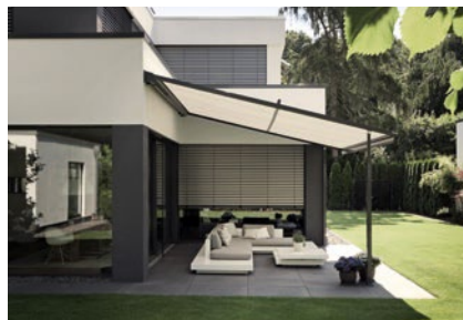
weinor Plaza Viva – die textile Pergola-Markise