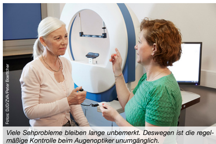
Viele Sehprobleme bleiben lange unbemerkt. Deswegen ist die regelmäßige Kontrolle beim Augenoptiker unumgänglich.

Der regelmäßige Besuch eines Augenoptikers ist unbedingt empfehlenswert, denn: Viele Sehprobleme werden zunächst nicht bemerkt, da sich die Sicht schleichend verschlechtert und dies meist keine unmittelbaren Beschwerden verursacht. Zusammen mit der sorgfältigen Brillenanpassung – vom optimalen Sitz bis hin zur passgenauen Glasstärke – bietet die Augenoptik und Optometrie ein vollumfassendes Servicepaket, bei dem geltende Arbeits- und Qualitätsrichtlinien berücksichtigt werden. (djd)